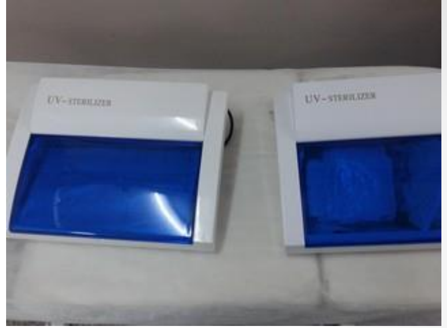
UV Sterilize Makinası