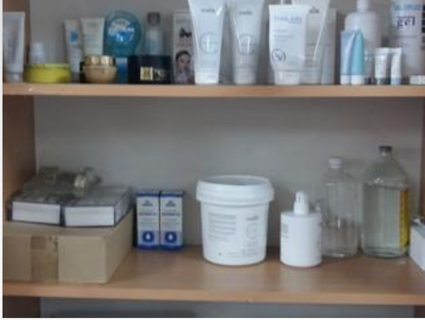
Cilt Bakımı Malzemeleri