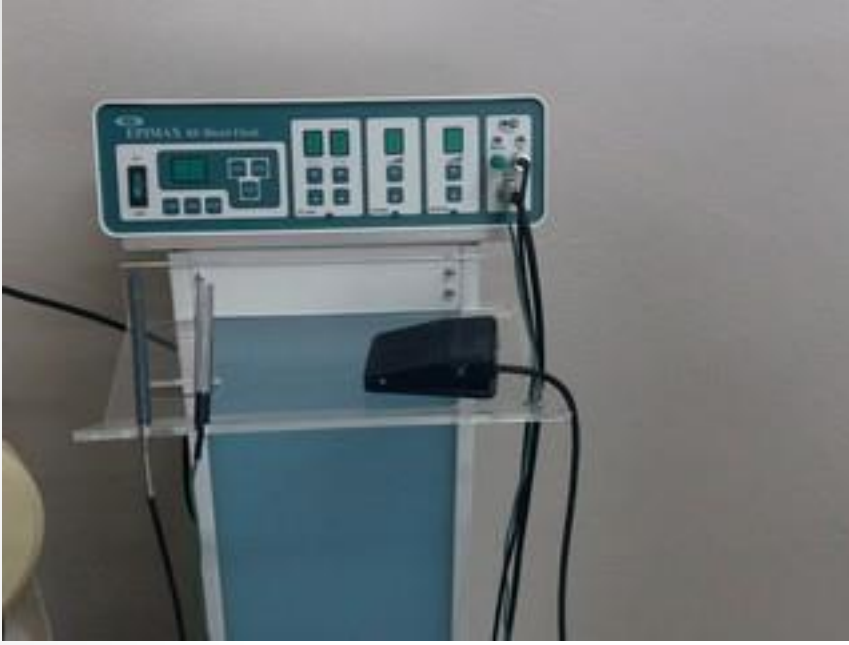
İğneli Epilasyon Cihazı