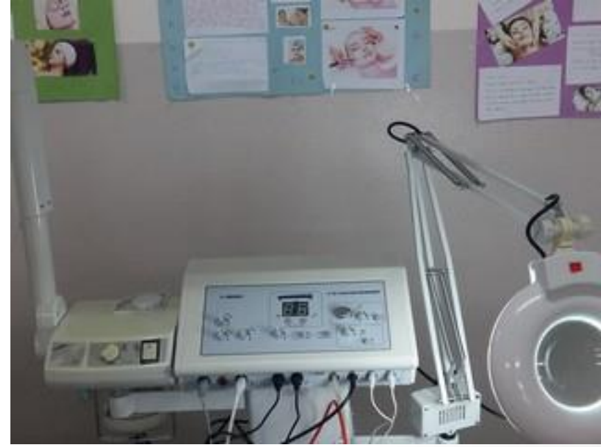
Cilt Bakımı Cihazı